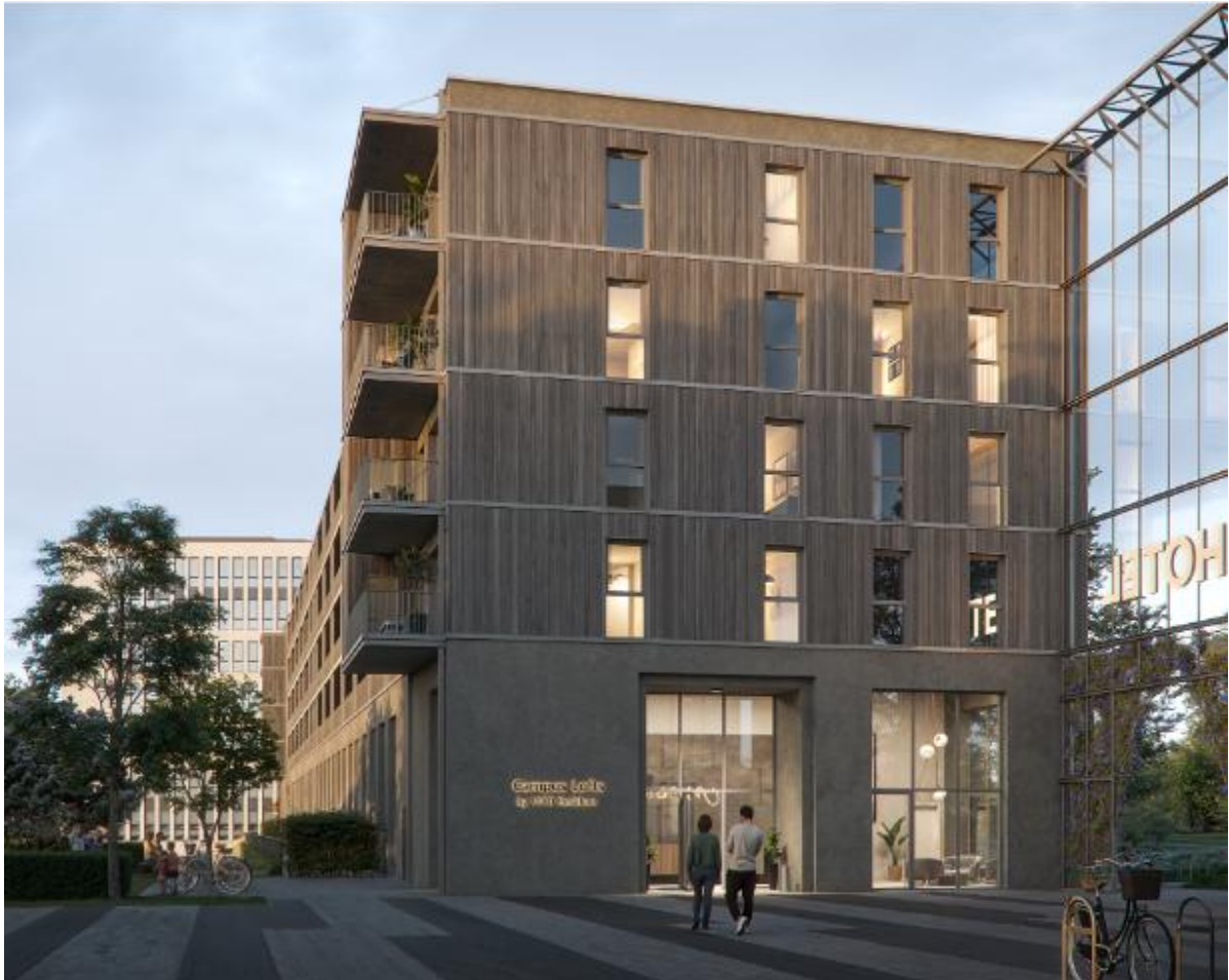
Zugang von Norden zur Lobby und Coworking