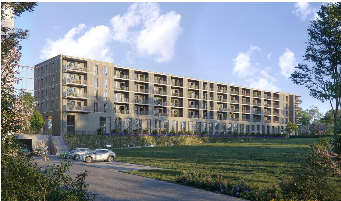
Ansicht von Osten/öffentlicher Park